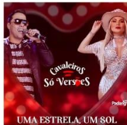
CAVALEIROS DO FORRÓ